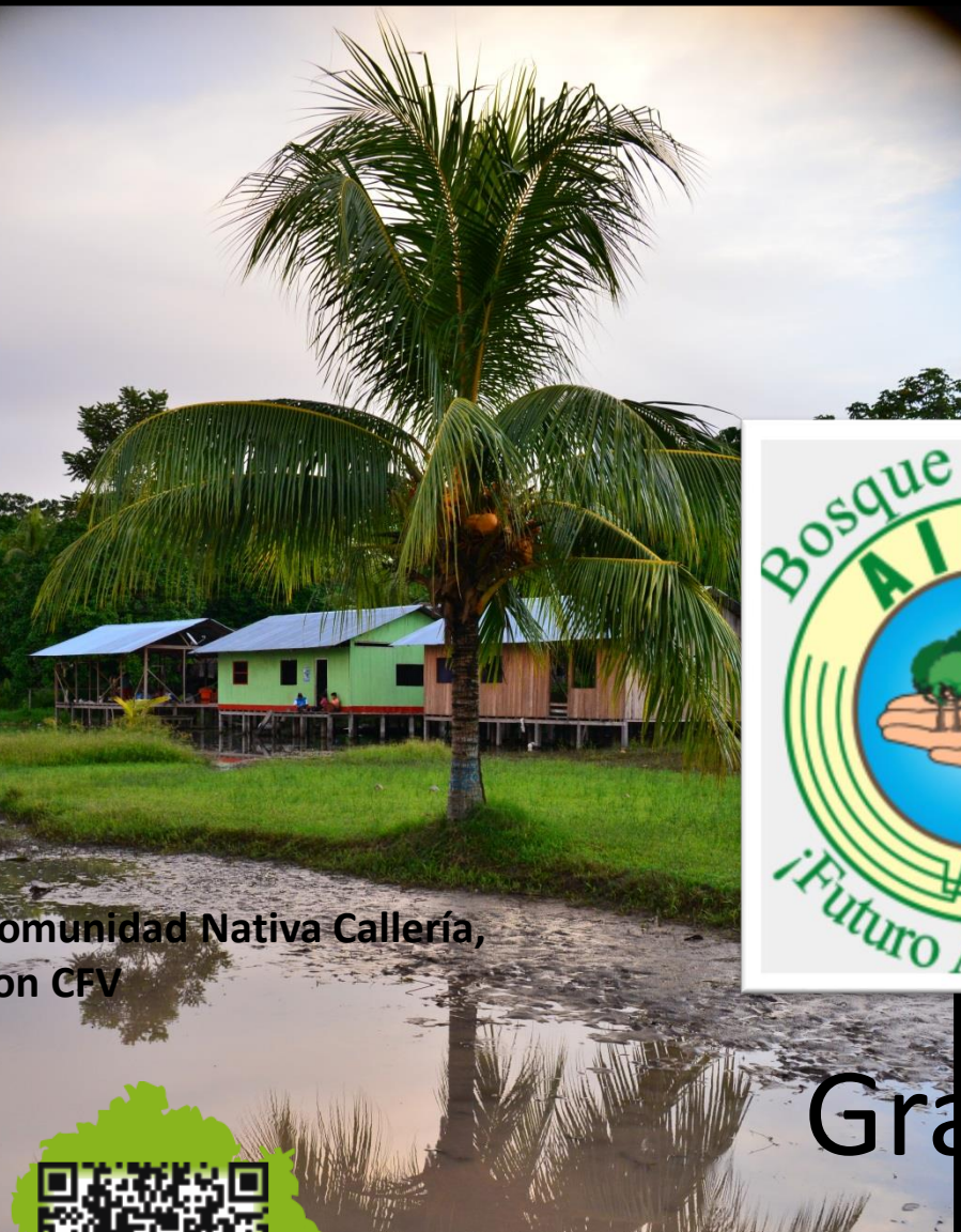
Comunidad Nativa Callería, con CFV