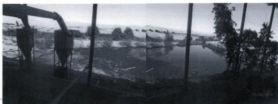
Laguna de aguas residuales paralelo al área de rendering de la Planta de Beneficio de Cerdos propiedad de la empresa Rico Pollo S.A.C.